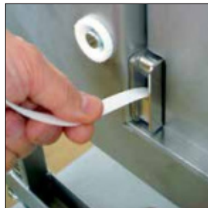
Fácil cambio de bobina