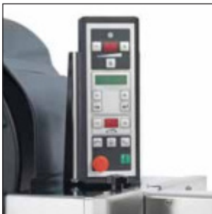
Ajuste fácil de la tensión del fleje con pulsador